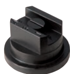
FF FLAT FAN