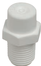
HCT HOLLOWCONE THREADED