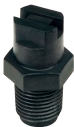
FFT FLAT FAN THREADED

Dimensioni (mm) Size (mm) Dimensiones (mm)